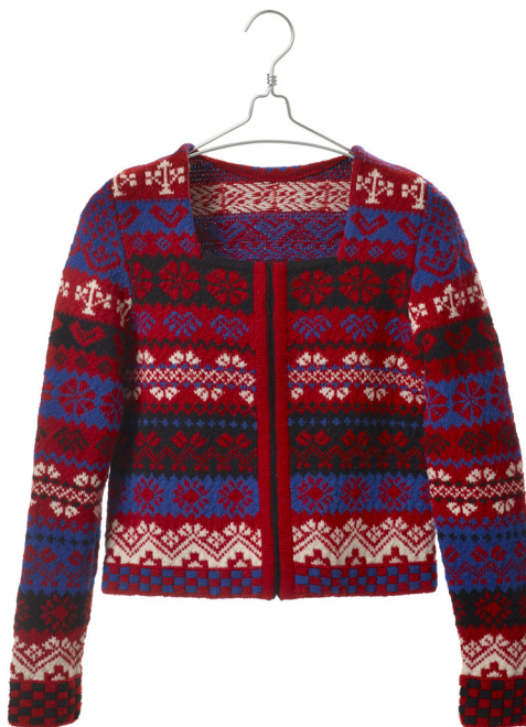
Fair hälsing – tröjan som blev ett knitalong på Facebook.

Under senhösten anordnade Svensk Hemslöjd en knitalong på Facebook med tröjan Fair hälsing från Sticka mönster av Ann-Mari Nilsson. Då boken är slutsåld tog förlaget fram ett mönsterblad för tröjan som såldes av Svensk Hemslöjd i samband med denna aktivitet.