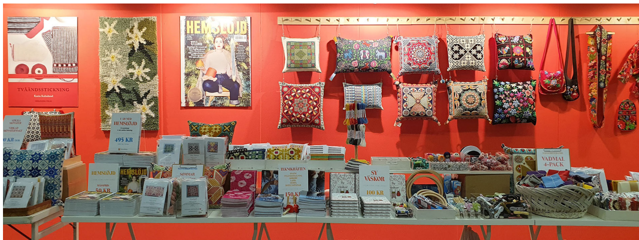
Hemslöjdens förlags monter på Syfestivalen våren 2020.

Tidningen har under en lång rad av år fått olika utmärkelser, till exempel Årets tidskrift 2019, och under 2020 vann tidningen Publishingpriset för åttonde gången.