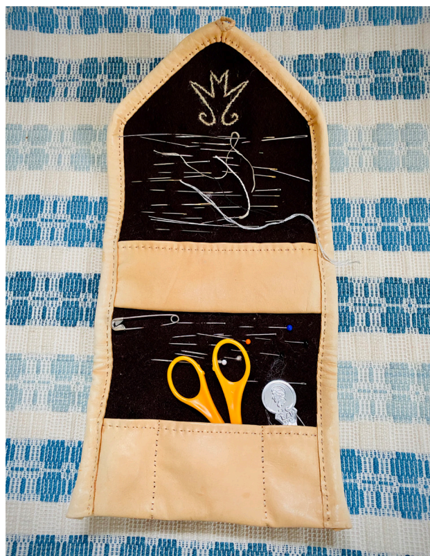
Broderat bomärke i nålbrev ur privat samling.

För att locka till märkning med monogram och bomärken genomförde SHR Instagramkampanjen #hurmärkerdu inför Hemslöjdens dag, vilket resulterade i ungefär 135 inlägg. Fem vinnare korades.