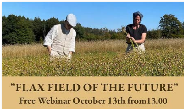
Marknadsföring för "Flax field of the future".