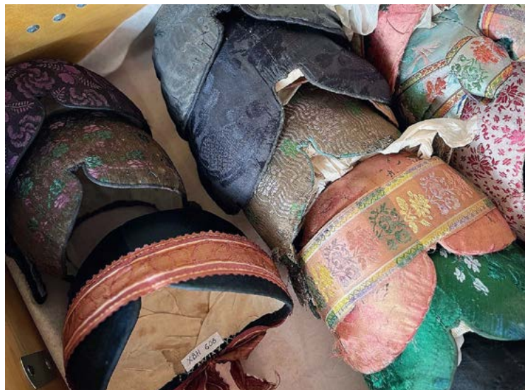
En samling bindmössor från digitaliseringsarbetet av samlingarna i Bollnäs-Voxnadalens hemslöjdsförening.

Följande föreningar hade föremål och bilder i Digitalt museum 2023: