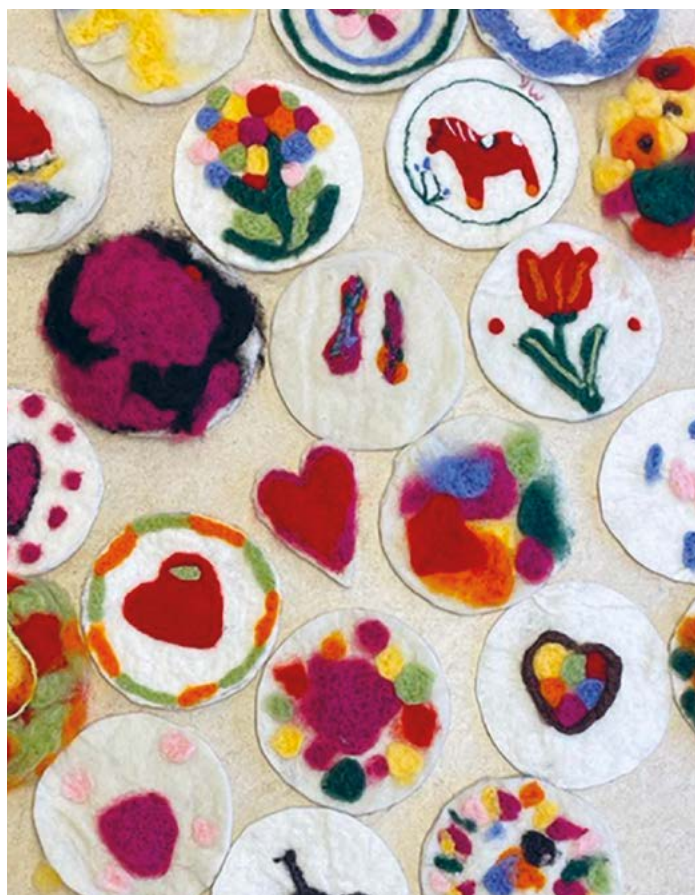
Bild från workshop i nåltooning.