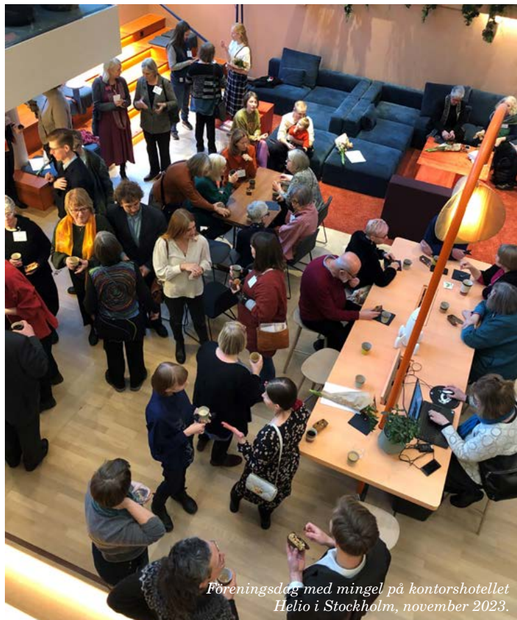
Föreningsdag med mingel på kontorshotellet Helio i Stockholm, november 2023.