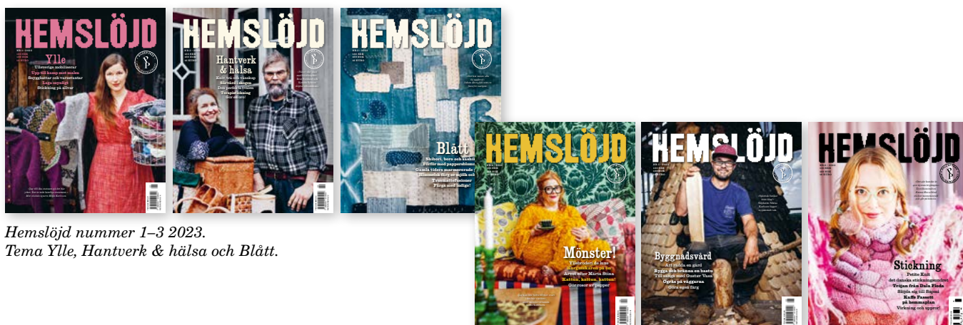
Hemslöjd nummer 1–3 2023. Tema Ylle, Hantverk & hälsa och Blått.

Prenumeranterna utgör grunden för tidskriftens ekonomi. Antalet prenumeranter skiftar från nummer till nummer, men årets sista utgåva, nummer 6, nådde 11 578 prenumeranter. Utöver det såldes 1 932 lösnummer av samma utgåva.