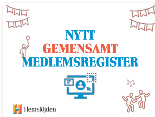
Bild från informationswebbinariet kring det nya medlemsregistret.

Föreningarna använder registret till att hantera och kontakta sina medlemmar och är därmed ett viktigt arbetsredskap för dem. SHR:s riksförbundskansli erbjuder service och support för föreningarna i arbetet.