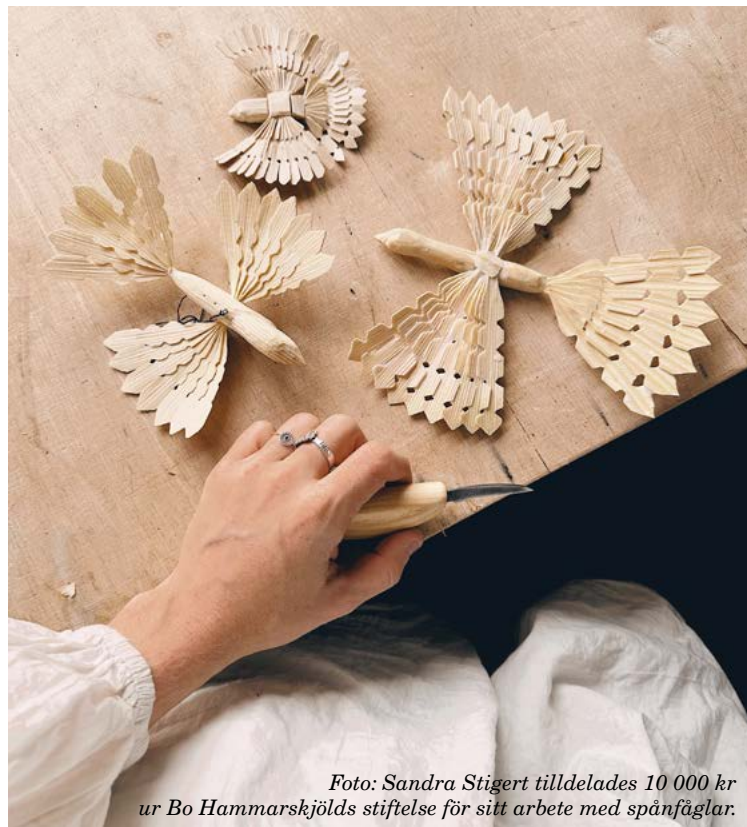
Foto: Sandra Stigert tilldelades 10 000 kr ur Bo Hammarskjölds stiftelse för sitt arbete med spånfåglar.