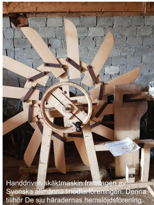
Handdriven skäktmaskin framtagen av Svenska allmänna linodlarföreningen. Denna tillhör De sju häradernas hemslöjdsförening.

Hur kommer det sig att linodling minskade under 1950-talet? Detta var tiden då hemslöjdsrörelsen var tongivande, både på formområdet och vad det gällde kvalitet. En tid känd för sitt starka textila formspråk med textilformgivare som t ex Astrid Sampe, inhemsk industri som producerade textil av utmärkt kvalitet och en optimistisk köpstark kundkrets. Marknaden dumpades. Den mesta råvaran som användes i industrin kom från östeuropeiska länder och den inhemska varan kunde inte, trots statliga stödinsatser konkurrera prismässigt. På 1960-talet drogs stödet till beredningsverket in. Resultatet blev att beredningsverket i Laholm lades ned 1966. Då upphörde linodlingen i princip över en natt. Det fanns ingenstans att skicka sin linhalm längre. Frågan om textiltillgång vid krig var fortfarande aktuell men man resonerade att det var billigare att lägga upp beredningslager av importerade textiltillgångar än att hålla igång en lokal produktion. Beredningslager av linråvara, garn och linneväv lades upp och förvaltades ända fram till 1990-talet. Då såldes