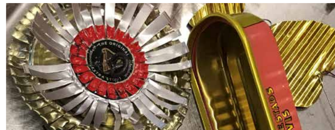
Bild från en träff med plåtslöjd i Slöjdklubben.

Annicka berättade om den verksamhet hon under många år arbetat med i region Jämtland-Härjedalen. Hon beskrev hur hon samarbetat med region, kommun och studieförbund för att bland annat genomföra Slöjdkollo , Slöjdekvällar och Slöjdklubbar på olika platser och vad de olika träffarna hade för olika förutsättningar när det kom till ekonomi, marknadsföring och planering. Under detta första webinarium presenterades även projektet i sin helhet och möjligheten att ansöka om det individuella stödet.