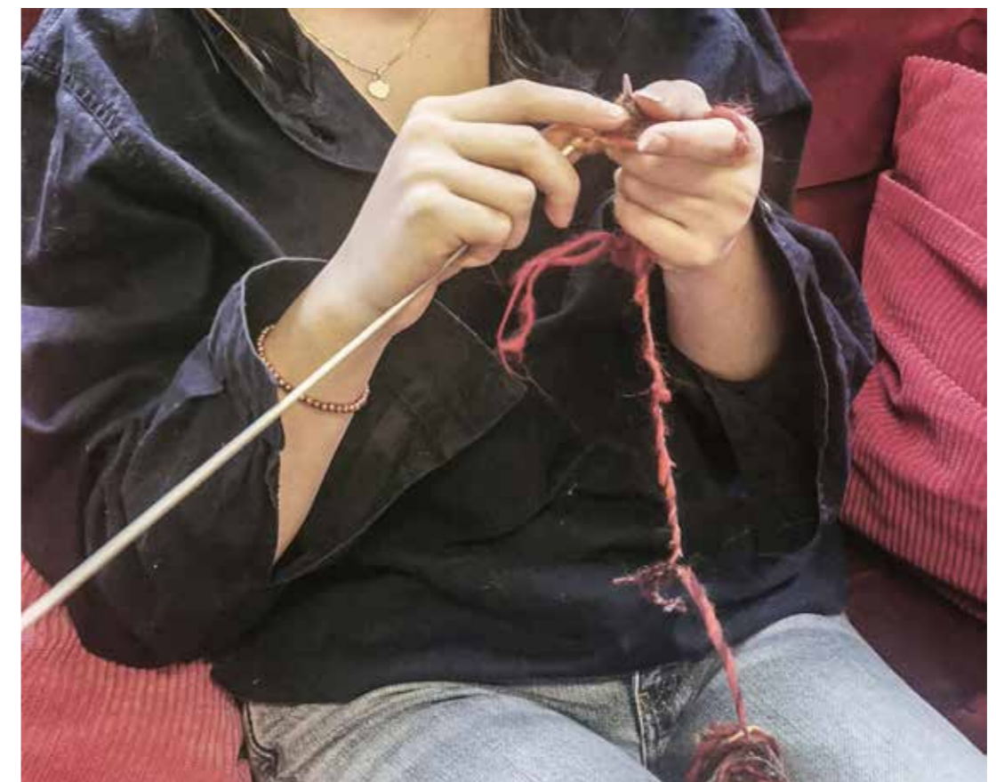
Bild från en workshop i stickning.