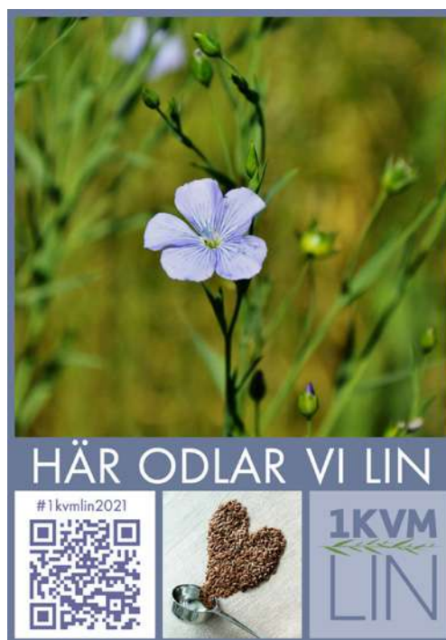
Odlingsskylt från projektet 1 kvm lin

1 KVM LIN startade som ett regionalt projekt i Västra Götalandsregionen 2020 och blev ett rikstäckande projekt 2021. Projektet fick snabbt ett stort genomslag och landade i att över 6 000 deltagare odlade lin under