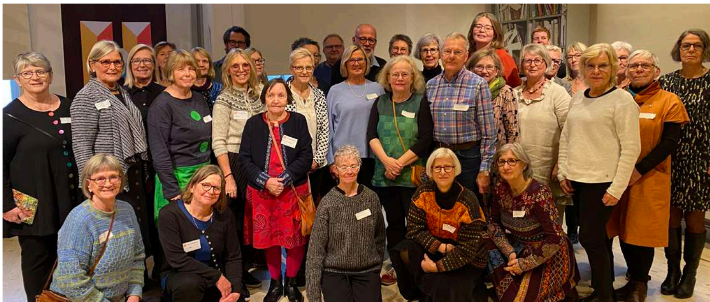
45 personer deltog på föreningsdagen i november 2021. Det var det första fysiska mötet på över ett år!