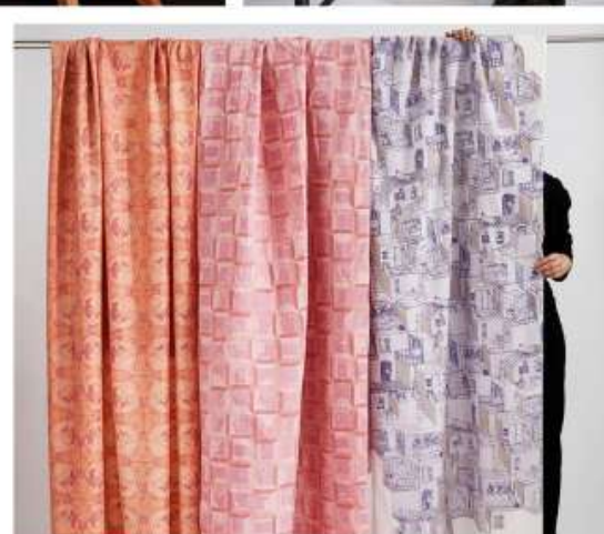
Skåp i intarsia av Lauranne Chapelle-Barry, räcke i smide av Fredrik Nordebo och textila tryck av Lisa Hüls.