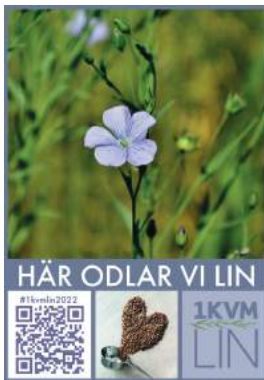
Odlingsskylt från projektet 1 kvm lin

SHR planerar, samordnar och genomför årligen "Hemslöjdens dag" första lördagen i september. Hemslöjdens dag genomfördes den 3 september 2022. Hemslöjdens dag är ett sätt att tillsammans med länsförbund och lokalföreningar synliggöra hemslöjdsrörelsen och verksamheten – framför allt för allmänheten och för de