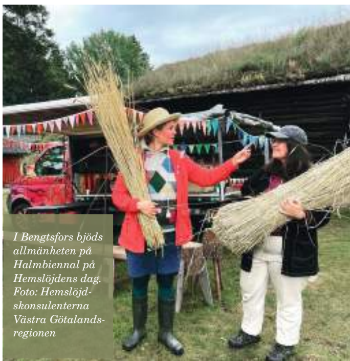
I Bengtsfors bjöds allmänheten på Halmbiennal på Hemslöjdens dag.