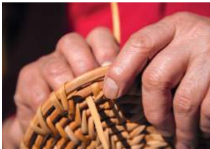
I Sverige har vi en rik och varierad korgtradition. Men, allt färre slöjdare behärskar de traditionella teknikerna.

Mästarbrevet är det högsta beviset på yrkesskicklighet inom ett hantverksyrke och garanterar stort yrkeskunnande och erfarenhet som hantverksföretagare. För att erhålla mästarbrev krävs minst 10 000 timmar i yrket vilket motsvarar sex års dokumenterad