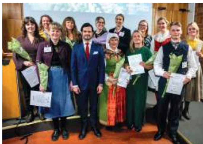
Prins Carl Philip med Hemslojdens stipendiater.