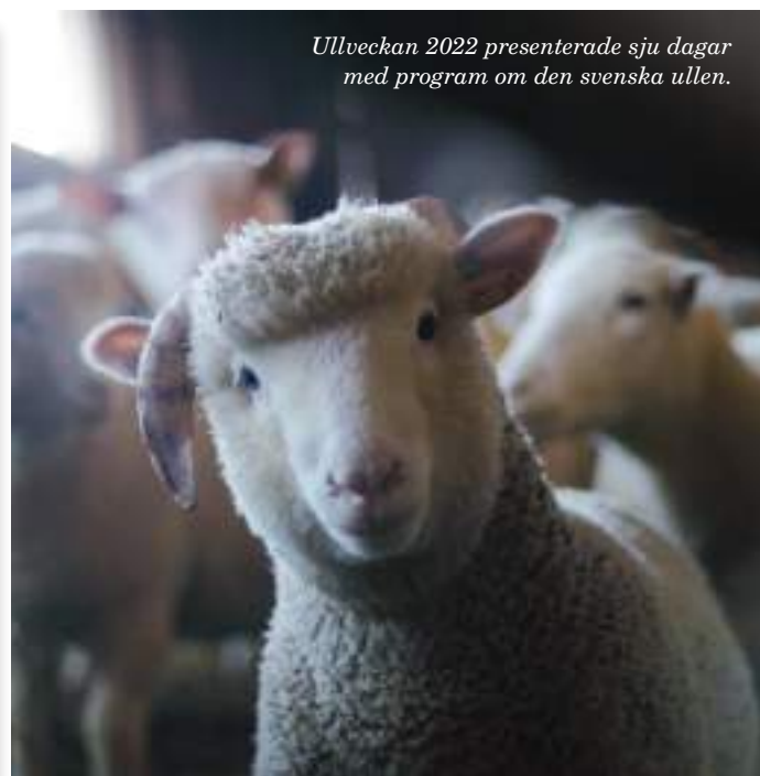
Ullveckan 2022 presenterade sju dagar med program om den svenska ullen.