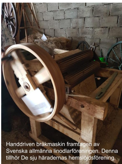
Handdriven bråkmaskin framtagen av Svenska allmänna linodlarföreningen. Denna tillhör De sju häradernas hemslöjdsförening.

Första världskriget, och de handelshinder som världskriget medförde, ökade efterfrågan på inhemsk textil råvara och efter krigets slut låg linproduktionen på en omfattning av 4000 hektar.