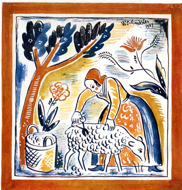
Illustration: Jerk Werkmäster, Dalarnas Hemslöjd Minnesskrift 1927

Välkommen in i slöjdens värld och låt dig inspireras!